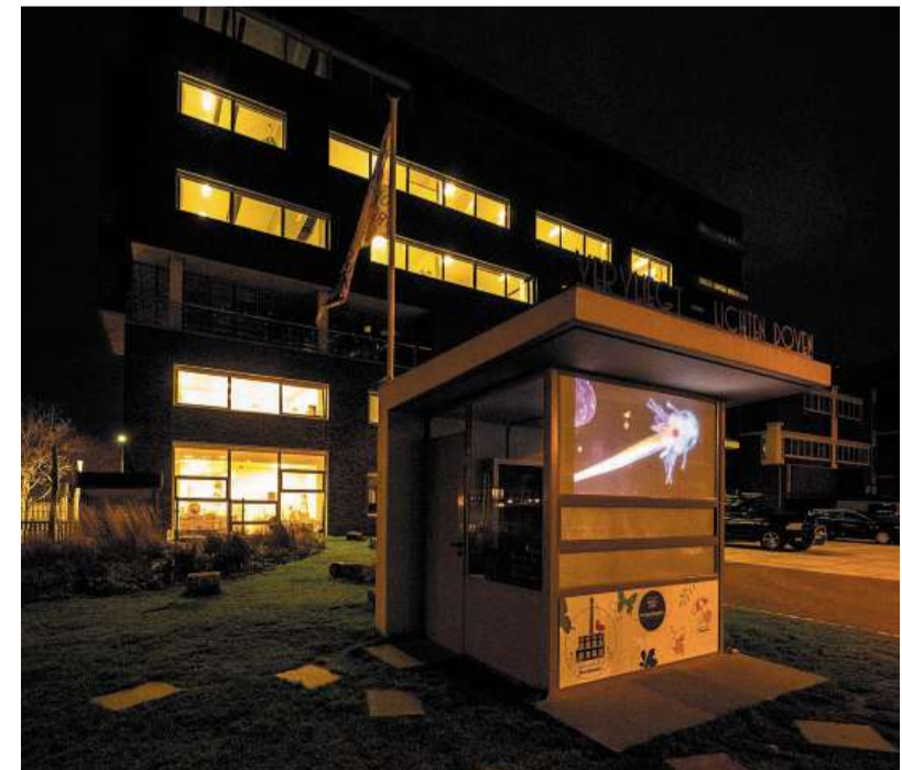
Op de portiersloge worden korte films vertoond.