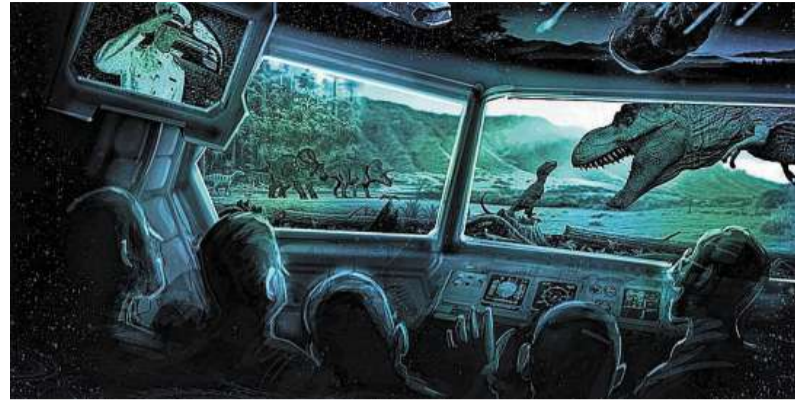
Artist impression van de Rexperience, die in Naturalis komt.